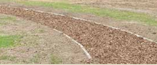
Finse piste heraanlegd (p. 2)