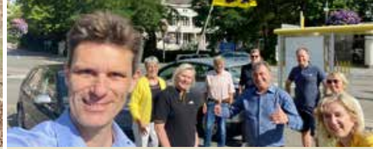
N-VA De Pinte steunt lokale middenstand (p. 3)