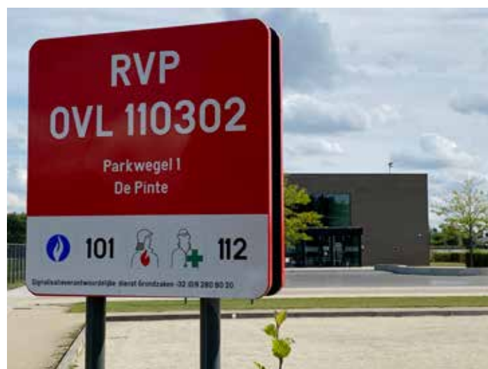
▲ Een rendez-vous punt is nuttig voor de hulpdiensten.

Ter hoogte van het bord kan dan iemand de hulpdiensten opwachten en hen begeleiden naar het slachtoffer. Ook in Zevegem staat er een dergelijk bord aan de gemeentelijke loods waar beide petanqueclubs uit onze gemeente vaak samenkomen. Eerder dit jaar was daar ook een voorval waarbij de hulpdiensten de locatie moeilijk konden vinden.