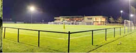
Verleiding Sportpark Moerkensheide (p.3)