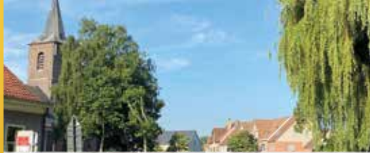
Herinrichting dorpskern Zevegem (p.2)